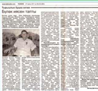
“Теләче” гәзитасы, 2011 ел, 27 июль, №58 (965)